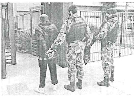
Menor foi apreendido na Rua Avelino dos Santos enquanto vendia tóxicos para usuário

Com ele, os policiais encontraram uma porção de maconha e uma quantia de dinheiro. Com o condutor do Voyage, foram apreendidas quatro porções de maconha que haviam sido compradas. No momento em que os PMs fizeram uma averiguação na "boca", também usada como estrebria, um homem que estava no interior fugiu e não foi possível localizá-lo. Ao lado do portão, havia uma sacola preta contendo mais uma quantidade de entorpecentes.