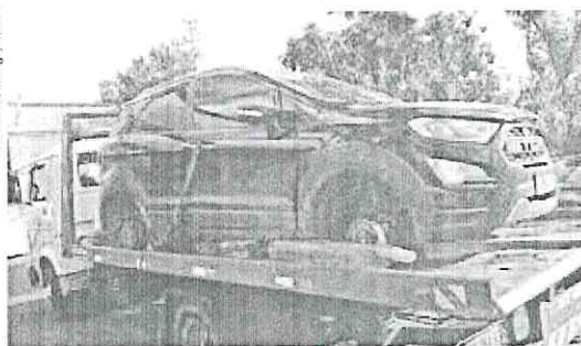
Ford Ecosport foi achado em Picada Mariante, sem as rodas e com marcas de tiros